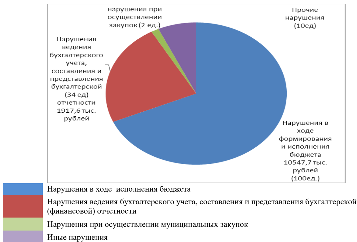
Диаграмма 1. Сведения о нарушениях в количественном и суммовом выражении

Нарушения при формировании и исполнении бюджета выявлены в 100 случаях. В основном это нарушения порядка формирования и доведения муниципального задания, нарушения порядка и условий оплаты труда, невыполнение муниципальных задач и функций, нарушения порядка реализации муниципальных программ.