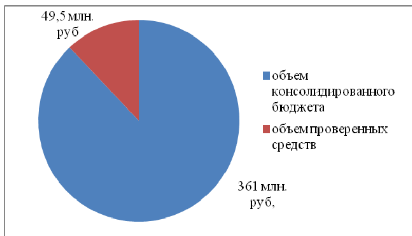
Диаграмма 4. Удельный вес проверенных в средств в общем объеме расходов консолидированного бюджета.

По результатам проведенных контрольных действий в отчетном периоде выявлено нарушения на сумму 6140,8 тыс. рублей, в том числе при внешней проверке бюджетной отчетности 4929,9 тыс. рублей.