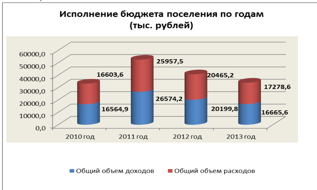
Рис. № 1

Динамику исполнения бюджета поселения можно проследить по годам (Рисунок № 1):