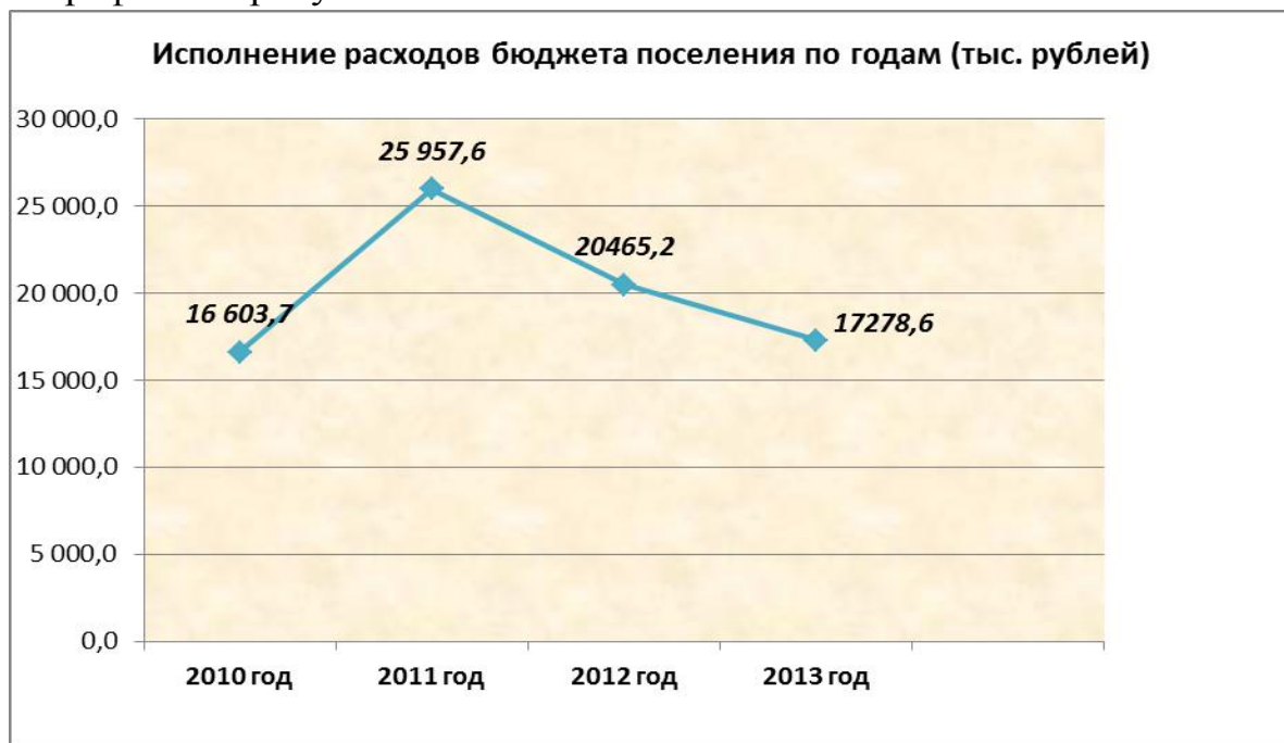
Рис. № 3

Наиболее наглядно исполнение бюджета поселения по расходам отражено в графике на рисунке № 3: