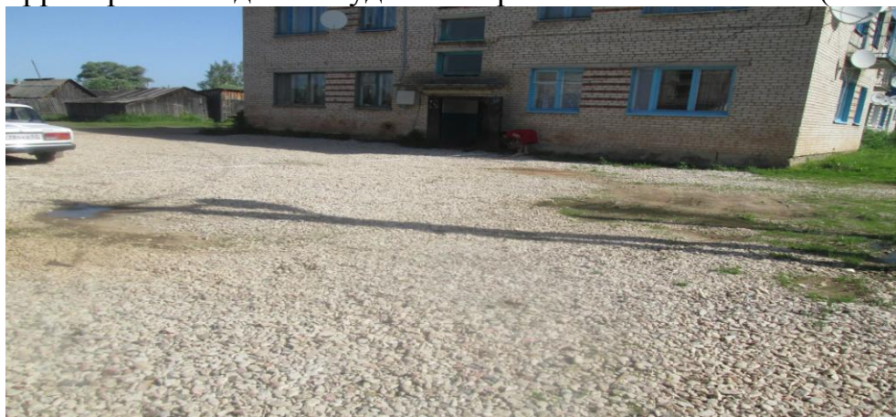
Фото 2. Дворовая территория д. 10,12 ул. Заводская

В 2013 году проводился ремонт дворовых территорий домов, расположенных по ул. Заводская № 10 и 12 (532 кв.м) и 37 кв.м проезда к вышеуказанной дворовой территории. Произведено устройство подстилающих и выравнивающих слоев оснований их щебня. По результатам обмеров расхождений с объемами указанными в актах выполненных работ не установлено, дворовая территория находится в удовлетворительном состоянии (Фото 2).