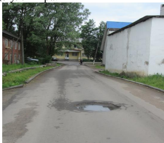
Фото 3и 4. Деформация дорожного полотна на ул. Погорелова и проезда от ул. К. Маркса до ул. Мира