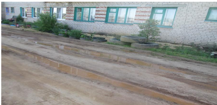
Фото 1. д. Федорково, ул. Заводская

В ходе контрольного мероприятия проведено обследование выполненных работ по улицам Набережная, Заводская, Комсомольская. По результатам обмеров расхождений с объемами указанными в актах выполненных работ не установлено. Тем не менее, выявлена деформация дорожного полотна, достаточно глубокие колеи и выбоины по ул. Заводская (Фото 1).