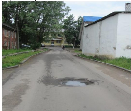
Фото 3и 4. Деформация дорожного полотна на ул. Погорелова и проезда от ул. К. Маркса до ул. Мира