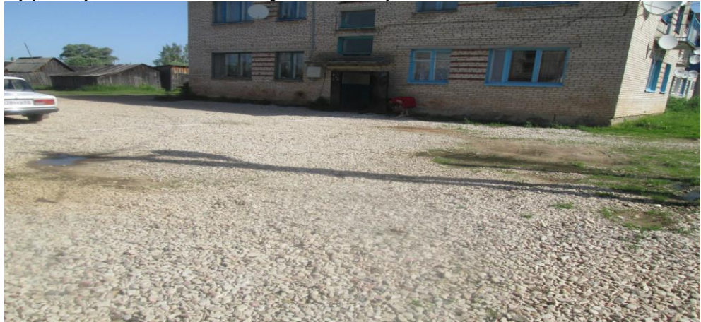
Фото 2. Дворовая территория д. 10,12 ул. Заводская

В 2013 году проводился ремонт дворовых территорий домов, расположенных по ул. Заводская № 10 и 12 (532 кв.м) и 37 кв.м проезда к вышеуказанной дворовой территории. Произведено устройство подстилающих и выравнивающих слоев оснований их щебня. По результатам обмеров расхождений с объемами указанными в актах выполненных работ не установлено, дворовая территория находится в удовлетворительном состоянии (Фото 2).